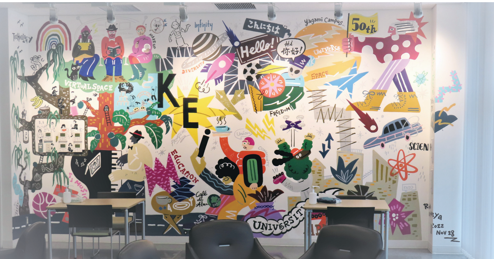
矢上開設50年記念ウォールアート（34棟1階壁面）