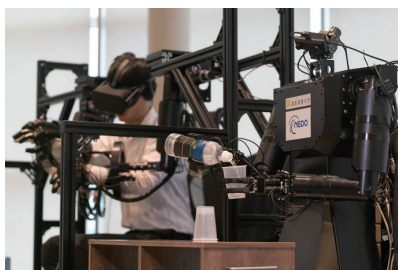
身体感覚を伝送可能な双腕ロボット

Recent advances of technology are achieved rapidly, but progress occurring independently in different fields of engineering, resulted in a plethora of technological elements that have never been properly integrated. The Center for System Integration Engineering intends to capitalize on recent advances in mechanical engineering and electrical/electronic and information engineering in an effort to create integrated systems. We intend to create new engineering values and design technologies by optimizing and integrating design within the broader environment of society and nature.