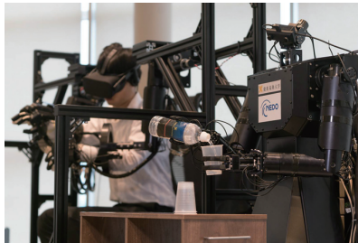
身体感覚を伝送可能な双腕ロボット

Recent advances of technology are achieved rapidly, but progress occurring independently in different fields of engineering, resulted in a plethora of technological elements that have never been properly integrated. The Center for System Integration Engineering intends to capitalize on recent advances in mechanical engineering and electrical/electronic and information engineering in an effort to create integrated systems. We intend to create new engineering values and design technologies by optimizing and integrating design within the broader environment of society and nature.